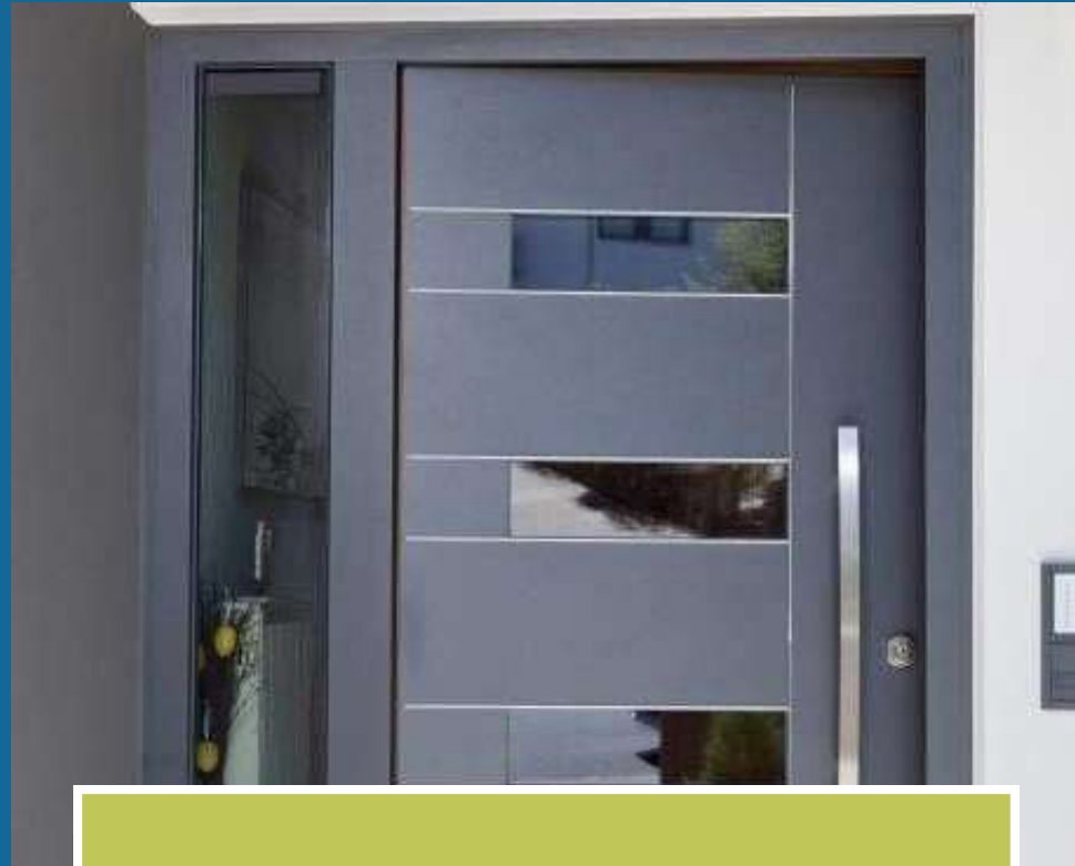
Puerta de Edificio