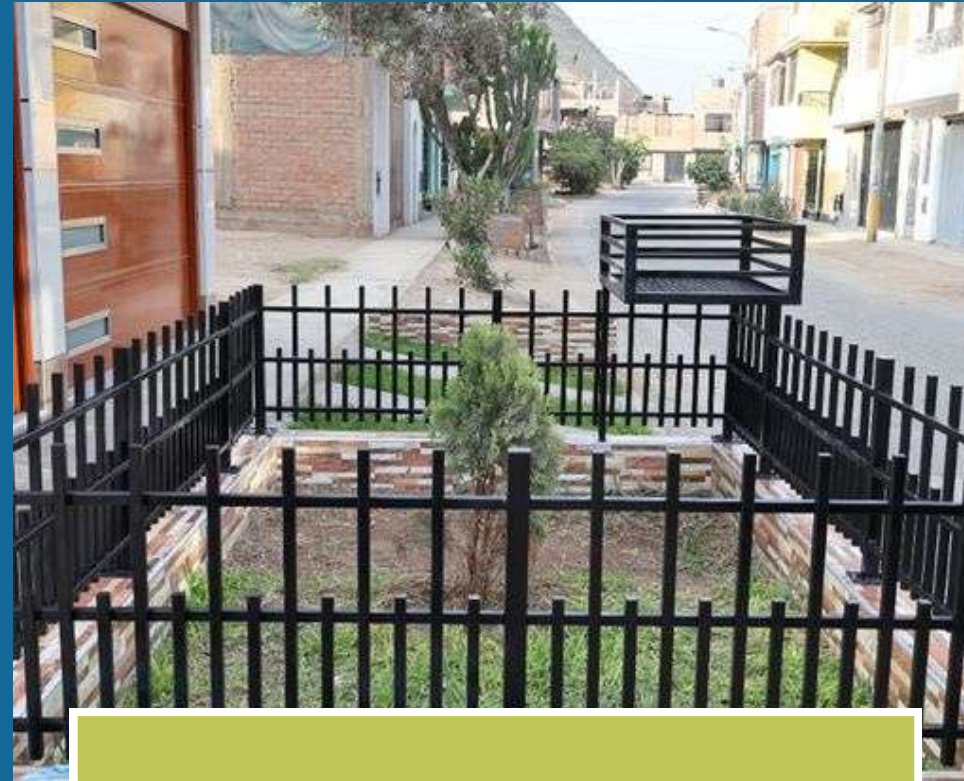
Cerco de Jardin