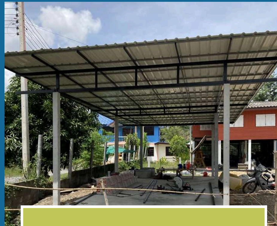
Techos de Aluzinc